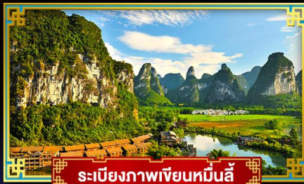
ระเบียบภาพเขียนหมื่นลี้