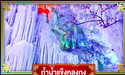
ถ้ำน้ำแข็งหลงกง

"เที่ยว 2 มณฑล กวางซี-ก๊วยโจว" สุดอลังการ น้ำตก 2 พรหมแดน แลหลังท่องเที่ยวระดับ 5A